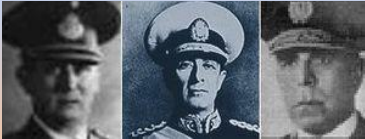
Arturo Rawson, Pedro Pablo Ramírez y Edelmiro Farrell

contra la presidencia de Ramón Castillo , denominada también como la “ Década infame ” por ser considerada como una continuación de la dictadura implantada en 1930. Esta interrupción fue llevada a cabo por el Grupo de Oficiales Unidos (GOU): Arturo Rawson, Pedro Pablo Ramírez y Edelmiro Farrell . Económicamente, continuó la política de industrialización , y por la sustitución de importaciones. Durante esta dictadura se fue gestando la figura del General Juan Domingo Perón , cautivando la admiración de la clase obrera, Como ministro y desde la Secretaría de Trabajo . La llamada a elecciones democráticas realizadas el 24 de febrero de 1946, en las que triunfó Juan Domingo Perón , asumiendo el poder el 4 de junio de 1946 .