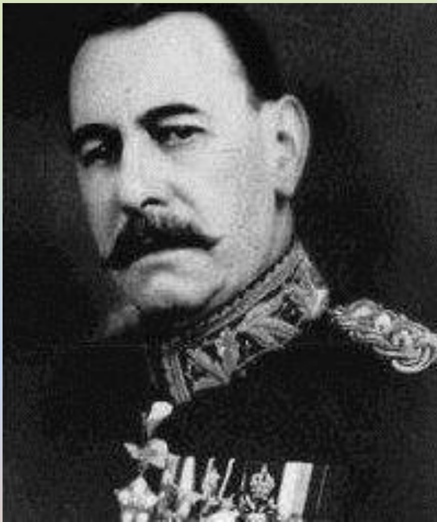
José Félix Uriburu

6 de septiembre de 1930 lo lideró el General José Félix Uriburu y Agustín P. Justo, con el objetivo de derrocar al presidente Hipólito Yrigoyen de la Unión Cívica Radical , quién en ese momento estaba en el segundo año de su segunda presidencia.